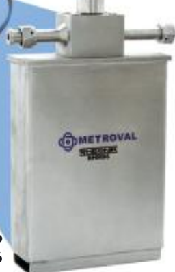
Medidor Mássico RHM-06

Micro processado Intrinsecamente seguro Alimentação automática Isolação galvânica Saída de pulso Interface RS 485