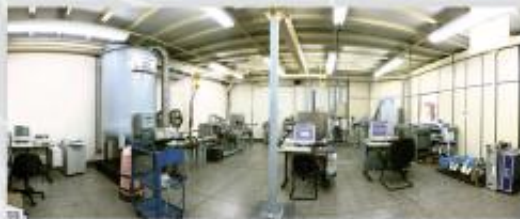
Laboratório de Calibração Mássica

A Metroval, empresa certificada ISO 9000, executa Serviços de Manutenção e Calibração de Medidores de vazão em Laboratórios acreditado pelo INMETRO e integrantes da RBC.