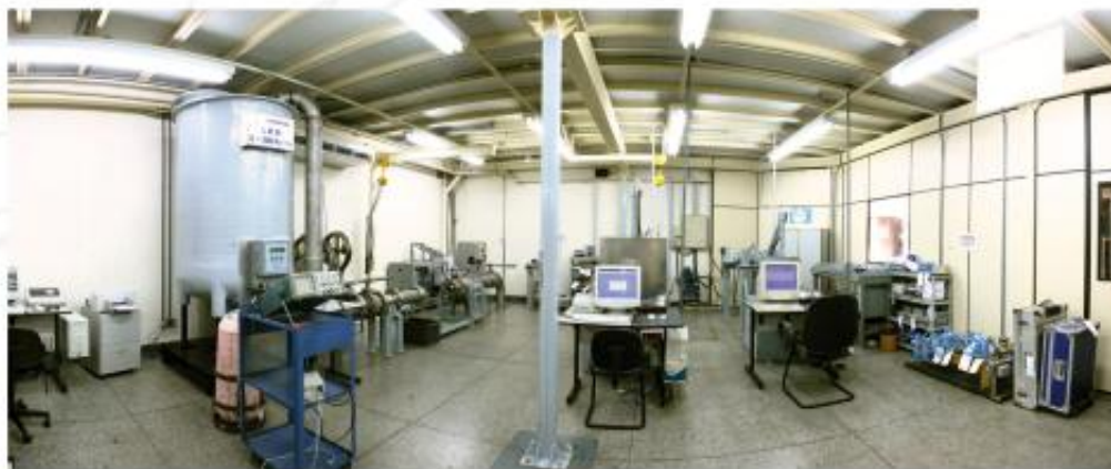
Laboratório de Calibração Mássica

O Laboratório de Vazão da METROVAL é composto de 9 bancadas de calibração sendo 6 volumétricas e 3 mássicas. Acreditado pelo INMETRO em conformidade com NBR-ISO/IEC 17025 e integrante da RBC é o laboratório de vazão que, no Brasil, reúne a mais ampla variedade de bancadas.