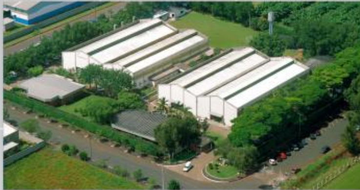
Instalações da Metroval - Nova Odessa - SP