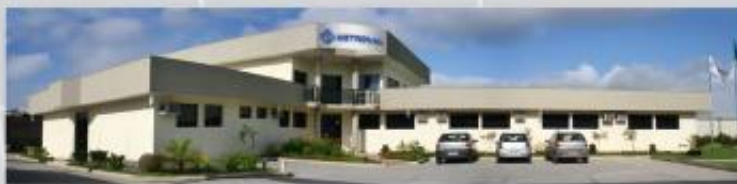
Instalações da Metroval - Macaé - RJ