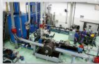
Laboratório de Calibração Volumétrica